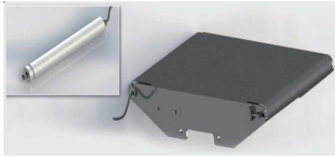
直驱型电动滚筒传动方式

直驱型电动滚筒推出后，随着我国快递物流和电商行业进入快速发展阶段，直驱型电动滚筒在国内快递物流输送分拣设备上快速推广和普及的过程中，标的公司经营团队积累了广泛和丰富的下游市场产品应用经验，熟悉各种应用场景中的各种需求，凭借核心团队在电机领域深厚的专业基础和丰富的开发经验，根据下游市场需求及变化，对产品进行不断改进和升级并推出新产品，使公司的技术和产品始终保持先进水平。核心团队顺应下游市场对快递物流输送分拣设备高效、节能、降本等方面不断提升的需求，先后开发出摆轮电动滚筒、直线电机等产品，具有先发优势，推出后在快递物流业得到快速推广应用。在发展过程中，核心团队还通过自主研发掌握了电动滚筒驱动和控制技术，标的公司具备了驱动器自产能力。标的公司已经具备伺服电动滚筒集成驱动器技术、摆轮滚筒及控制技术、工业输送用直驱电动滚筒设计技术、基于红外模块的驱动器无线通信技术、外转子永磁体检测技术、用于高动态响应滚筒电机外壳结构、永磁直线电机绕组设计和永磁直线电机驱动与控制技术等智能物流装备核心部件的关键技术。截至 2023年5月31日 ，标的公司拥有专利 52 项，其中发明专利 5 项，并取得 4 项软件著作权。