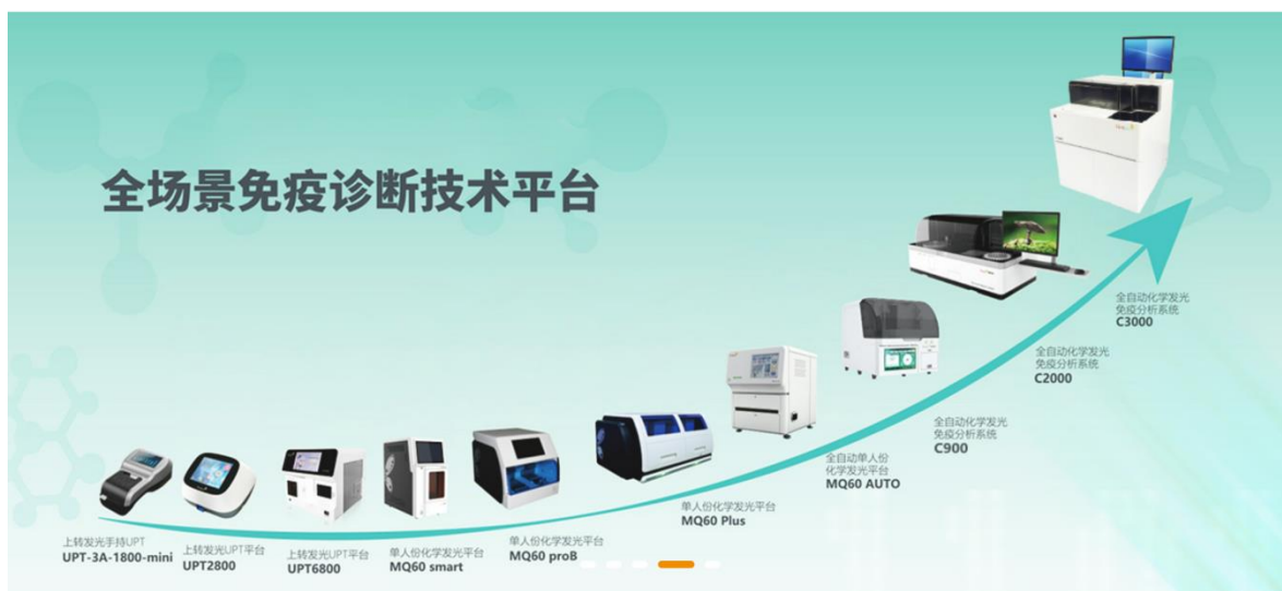
公司全场景免疫诊断平台示意图