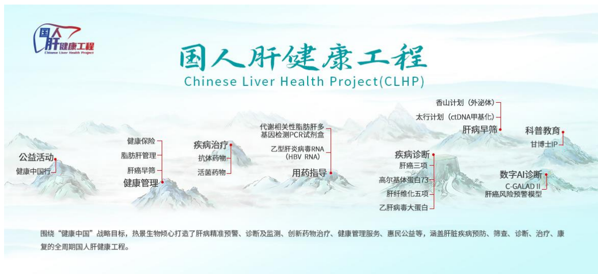
图：热景生物国人肝健康工程

1、公司核心产品肝癌三项（AFP、AFP-L3%及DCP）。作为“十三五”国家科技重大专项成果，打破国外垄断，填补国内空白；甲胎蛋白异质体比率（AFP-L3%）和异常凝血酶原（DCP、PIVKA-II），均为国内首个研发成功并上市销售的独家产品。其中，基于“糖捕获技术”研制的甲胎蛋白异质体检测试剂已从手工法迭代为全自动磁微粒化学发光法；通过研发产品升级，肝癌三项在全自动高通量检测设备上的检测效率提升一倍，达到 300T/小时，并以通过联机实现更效率的检测。