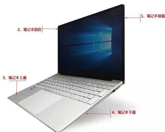
图：笔记本外壳示意图

公司为主流消费电子产品厂商提供精密结构件模组产品，其中以笔记本电脑结构件模组为主。笔记本电脑结构件模组包括四大件：背盖、前框、上盖、下盖以及金属支架，上述结构件模组在装配笔记本电脑过程中需容纳显示面板、各类电子元器件、转轴等部件，其结构性能对制造精度提出了较高的要求。同时由于其还具有外观装饰功能，故该产品对生产企业的设计能力亦有较高的要求。