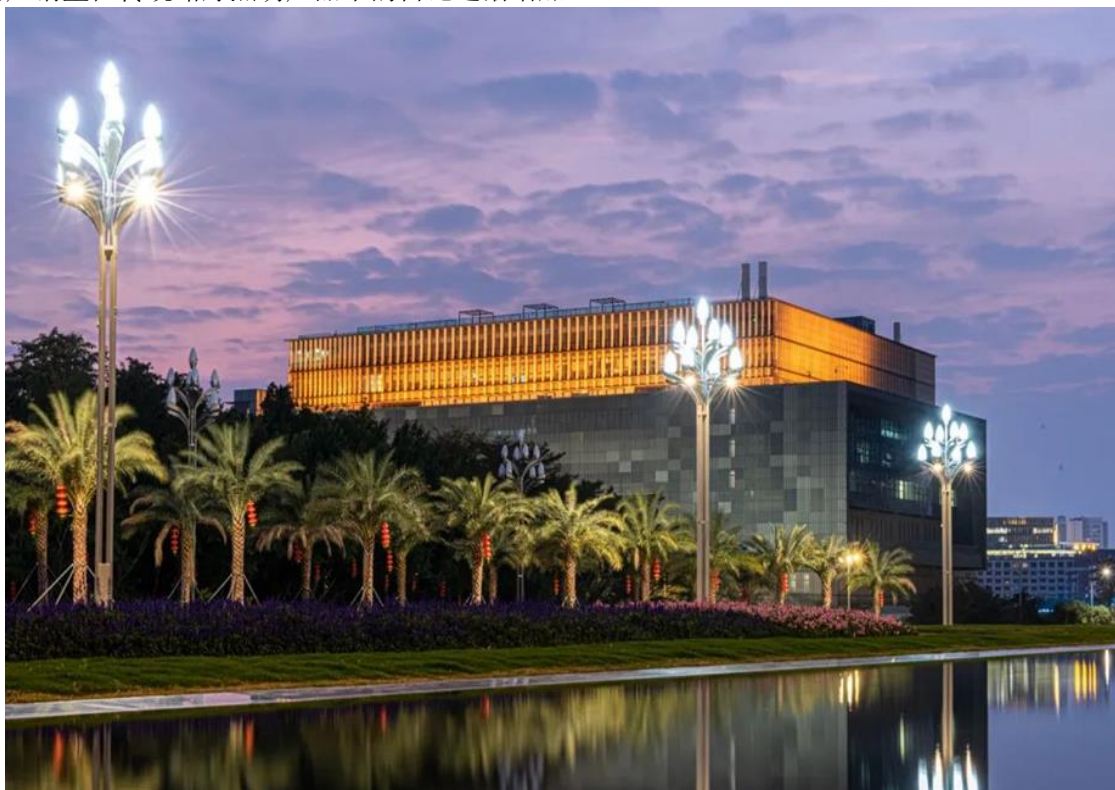
玉兰灯点亮广州白云国际会议中心天际线

公司传统照明产品以道路照明产品为主，同时包括少量景观庭院灯、景观照明产品。传统路灯照明产品中，以文化定制产品为主，主要包括玉兰灯、芙蓉中华灯、银杏灯等。近年来，随着公司制造能力及文化定制照明产品的客户需求不断提升，公司生产工艺更为复杂的文化定制类产品的产销量在传统路灯照明产品中的占比逐渐增加。