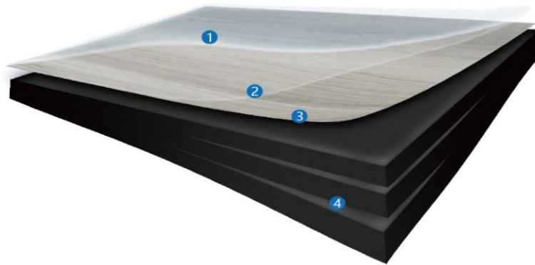
悬浮地板产品结构图