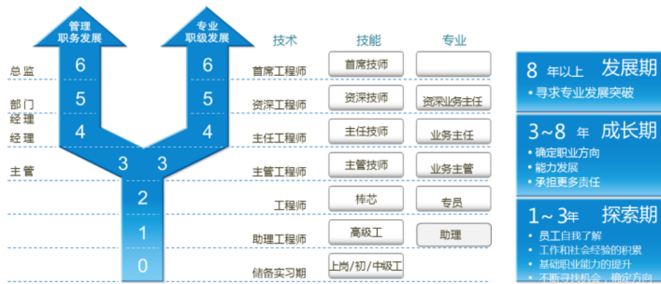
大 Y 发展通道模型