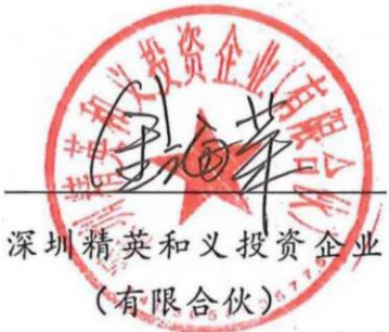
深圳精英和义投资企业 (有限合伙)