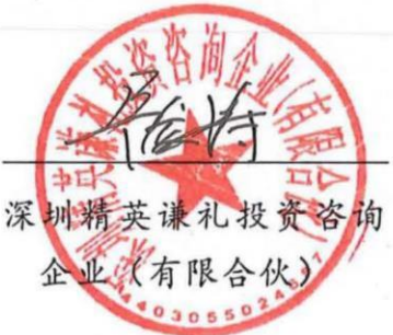
深圳精英谦礼投资咨询 企业 (有限合伙)