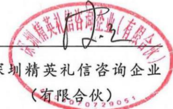
深圳精英礼信咨询企业 (有限合伙)