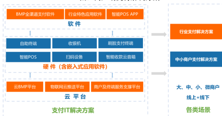
图：商户端支付解决方案

按照服务模式不同，商户规模大小，方案的个性化程度，技术实现难易程度，商户端支付解决方案分为行业支付解决方案及中小商户支付解决方案。