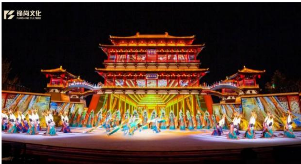
中国-中亚峰会文艺演出《携手同行》