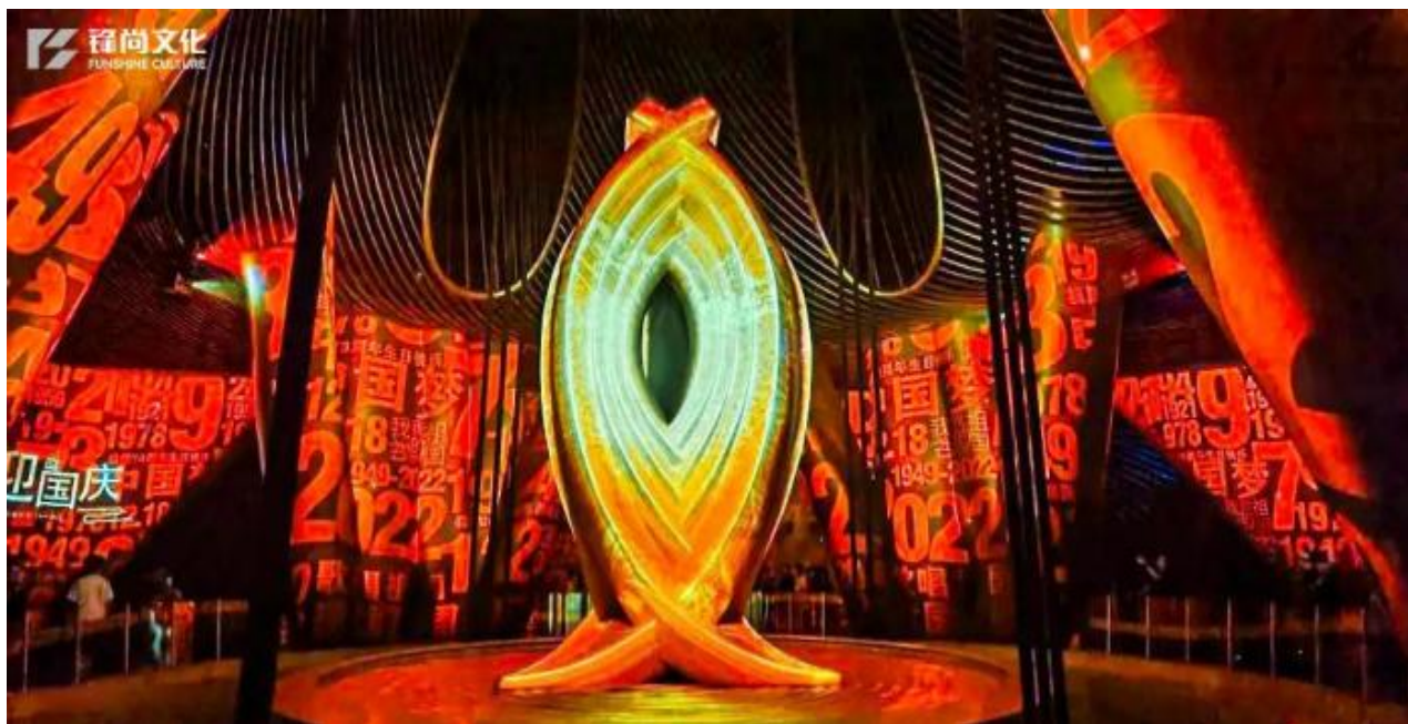
“天吋 (Sky632)” 光影科技互动沉浸式演绎

公司在稳定政府客户（ToG）和企业客户（ToB）以外，C 端运营类项目后续会成为公司业务发展重点。多年来公司在灯光、音响特效、效果展示等方面积累丰富经验，为其在 C 端市场的拓展提供了重要的优势。而 C 端客户也是对公司政府客户（ToG）和企业客户的（ToB）补充。