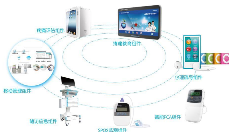
(iPainfree无线镇痛管理系统)

iPainfree®无线镇痛管理系统软件产品是一个基于移动互联网的虚拟无痛病房设备管理解决方案，具有无线综合疼痛评估、互动式患者疼痛教育、无线综合疼痛随访、个体化患者自控镇痛、PCA使用反馈、镇痛设备维保、疼痛心理疏导、无线镇痛体征数据收集、疼痛信息管理分析、分院质控管理等功能模块和硬件等功能。无线镇痛管理系统可以及时传递微电脑注药泵的运行数据和镇痛患者的相关数据，协助医护人员远程掌控患者疼痛相关医疗信息，提高镇痛质量，减少医疗差错，降低医护人员工作负荷，提升疾病诊疗的舒适化水平；同时，可以高效的储存大样本疼痛数据，为学术科研提供支持。有效实施无线镇痛管理系统，在发挥公司产品优势的同时，提高行业水准，并通过信息化样板医院的建设，进一步提升品牌影响力。