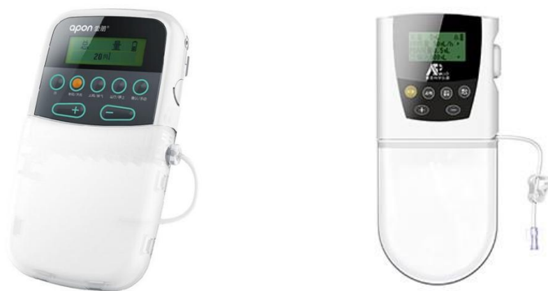
(爱朋牌电子注药泵ZZB-II)