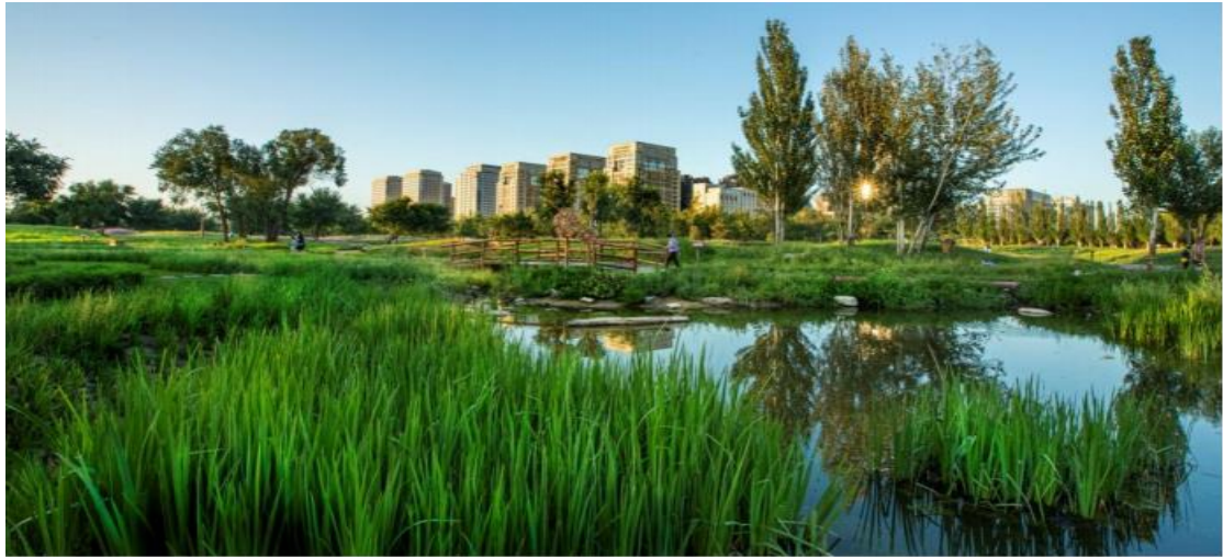
（呼和浩特小草公园一角）

针对规模化生态修复工程的需求，公司继续完善推广创新型新产品“生态种子包”系列产品。“生态种子包”以生态产业大数据平台为依托，根据不同地区、不同立地条件，模拟“天然植物群落”进行种子配比、种子包衣丸化、搭配有机肥、微量元素和菌肥等进行组合，有针对性的修复不同类型退化草原、矿山、废弃地，提升生态系统稳定性和生物多样性。报告期内，该系列产品运用于东乌珠穆沁旗草原修复、乌拉盖草原修复、乌拉特草原修复、万亩草原项目、阿鲁科尔沁草原山水林田湖项目、卓资山花田花海项目、金海高架桥两侧绿化项目、伊敏矿项目等取得良好的效果。