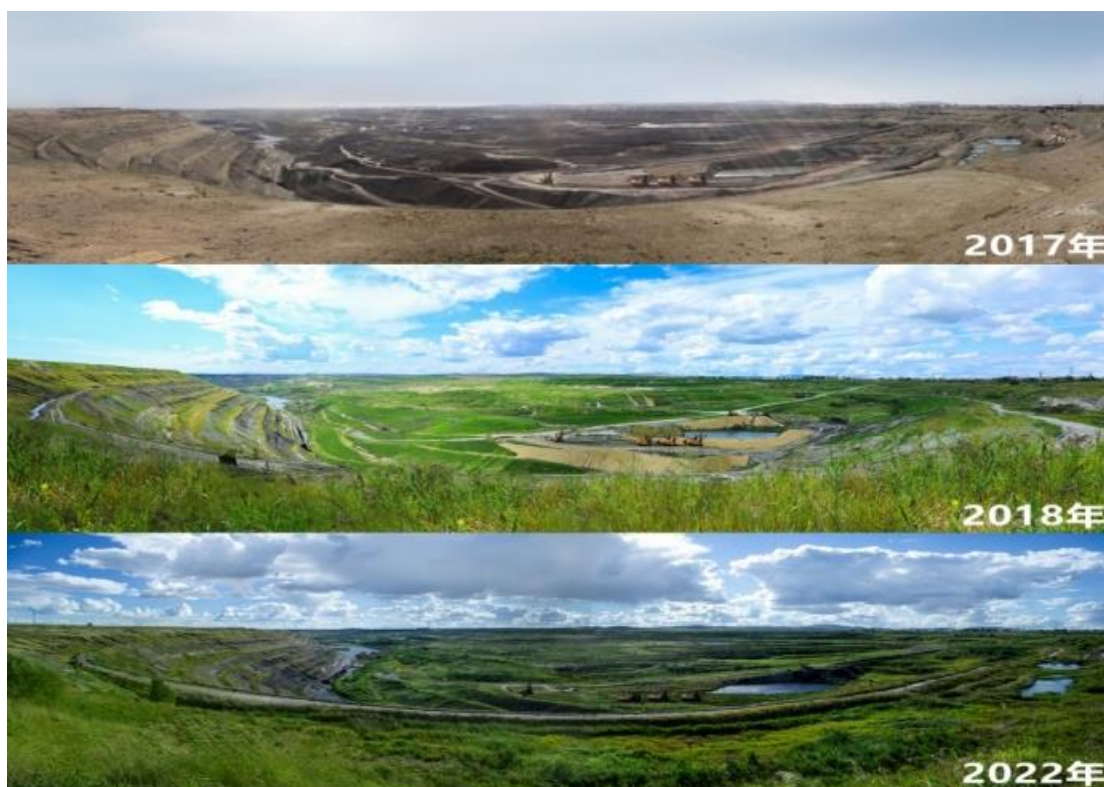
（扎赉诺尔矿山修复对比图）

公司一直以来坚持“先数据、再科研、后修复”的蒙草模式。依托“特色种业”+“数字技术”根据不同生态修复区域的地理位置、土壤类型、乡土植物等自然条件，给出“因地制宜”的解决方案，乡土种业体系科研成果应用于生态修复实践领域成果显著。2022 年，公司应用于呼和浩特敕勒川草原修复、乌拉盖河流域盐渍化草地治理、科尔沁沙化草地飞播、乌珠穆沁风蚀沙化草原修复、荒漠草原退耕地植被重建、呼伦贝尔扎赉诺尔露天矿生态修复的 6 项技术入选科创中国林草领域技术应用案例。这些技术应用案例作为能够“解决实际问题”的创新技术，涉及不同类型退化草原修复、矿山治理、生物多样性恢复等，通过中国科协“科创中国”平台向外推介，为带动林草领域创新技术成果快速转化提供技术支撑。