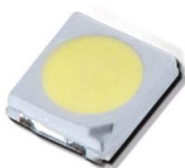
(4) 高光效 SMD 灯珠, 光效范围从 170lm/w—230lm/w