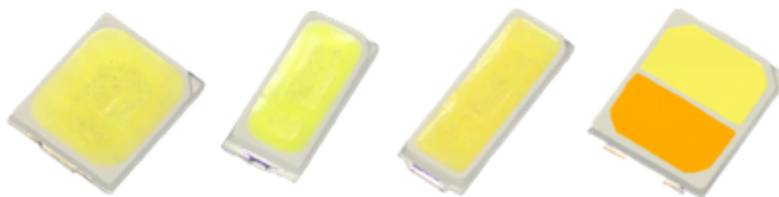
(2) 6—54v 高压 SMD 灯珠,主要电压有 6v、9v、12v、18v、36v、54v 等