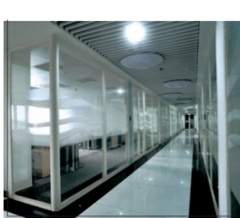
钢制防火玻璃门及隔墙