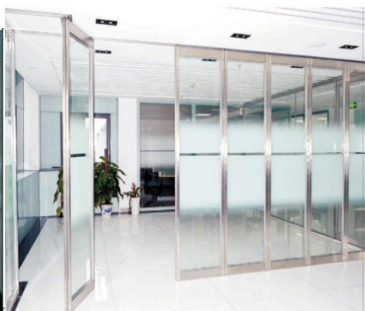
不锈钢防火玻璃平移门