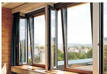
铝合金耐火节能窗