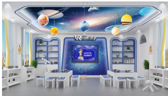
图 5: VR 未来教室效果图

报告期内，CG/VR 数字影像产品团队承接部分外部 CG 视效服务。公司承制了霍尔果斯火天大有文化传媒有限公司动画番剧《陆小凤》(腾讯平台)宣传片，并首次使用全 UE5 流程制作。同时，公司参与了部分游戏公司、互联网平台公司、影视动画公司出品的 CG 作品以及提供了技术支持，包括爱奇艺影业(上海)有限公司《六代钟馗》三维动画制作、苏州叠纸网络科技股份有限公司《奇迹暖暖》的部分动画和角色特效解算制作，北京百度网讯科技有限公司多个数字人资产制作，中视实业集团有限公司央视春晚片头 CG 部分镜头制作、UE 角色资产制作等。