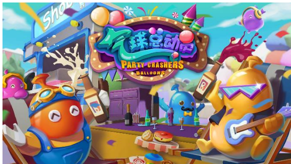
图 4: "Party Crashers: Balloons" (《气球总动员》)

VR 教育方面，基于目前素质教育市场的普遍需求，公司推出 VR 教育整体解决方案，通过提供硬件设备、软件系统、完整课程体系及培训运维服务，打造沉浸式、交互式的体验课堂。主要产品包括面向学前阶段用户的 VR 教育产品太空学院-VR 未来教室和太空学院-VR 科探区、面向中小学阶段用户的 VR 教育产品为红色 VR-爱国主义教育体验区。