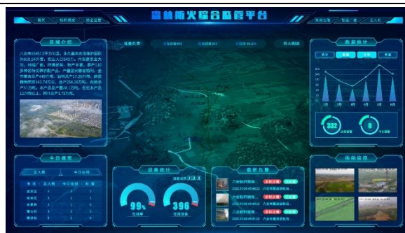
图 7：安徽赛达森林防火监管平台