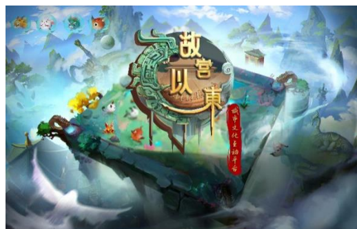
图 2：“故宫以东”城市文化互动平台地图界面