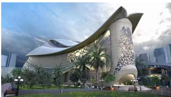
图 1：珠海横琴中医药科技创意博物馆项目实景图

LBE 城市新娱乐业务主要为客户提供从创意制作到实施建设的一站式服务。通过故事创意、场地游戏玩法设计、数字特效等内容创作以及特殊装置及设备、用户交互系统等研发制作提升主题场馆的内容表现力。公司根据客户需求提供整体方案设计服务、资源整合等服务。公司 LBE 业务包括珠海横琴中医药科技创意博物馆项目、北京市东城区文商旅融合项目“故宫以东”城市文化互动平台（“探城”文商旅互动平台）等。