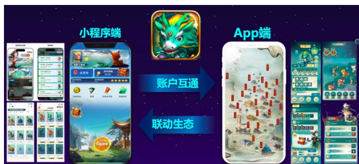
图 3：“探城”文商旅互动平台

“故宫以东”城市文化互动平台，是基于互动引擎技术，围绕东城区重要的古迹、故居、文物、景观、商业等内容进行数字化开发及虚拟线上转化，让用户能够参与到大型城市联动平台中的文商旅融合产品。该项目将综合运用自由探索、瑞兽养成、互动权益等模式把东城的文化有机、有趣地串联起来。在北京市科学技术委员会孵化和东城区文旅局资源支撑与深度合作下，该课题顺利通过北京市科学技术委员会专家组验收。报告期内，基于“故宫以东”城市文化互动平台，同步持续开发“探城”文商旅互动平台。