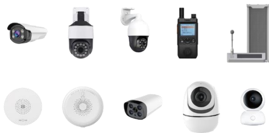
图 6：安徽赛达智能终端设备