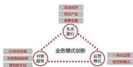
图表 13: 5G 融合技术应用赋能银行业务创新