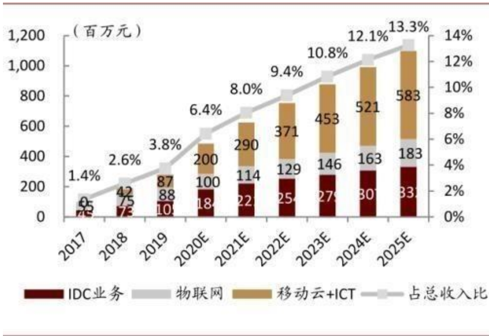
图表：中国移动：十四五产业互联网收入预测

持网络切片、边缘计算能力的全球5G R17标准的落地将推动5G专网业务，引导运营商在5G时代摆脱管道化定位，以高质量网络服务重新定义高附加值业务模式。