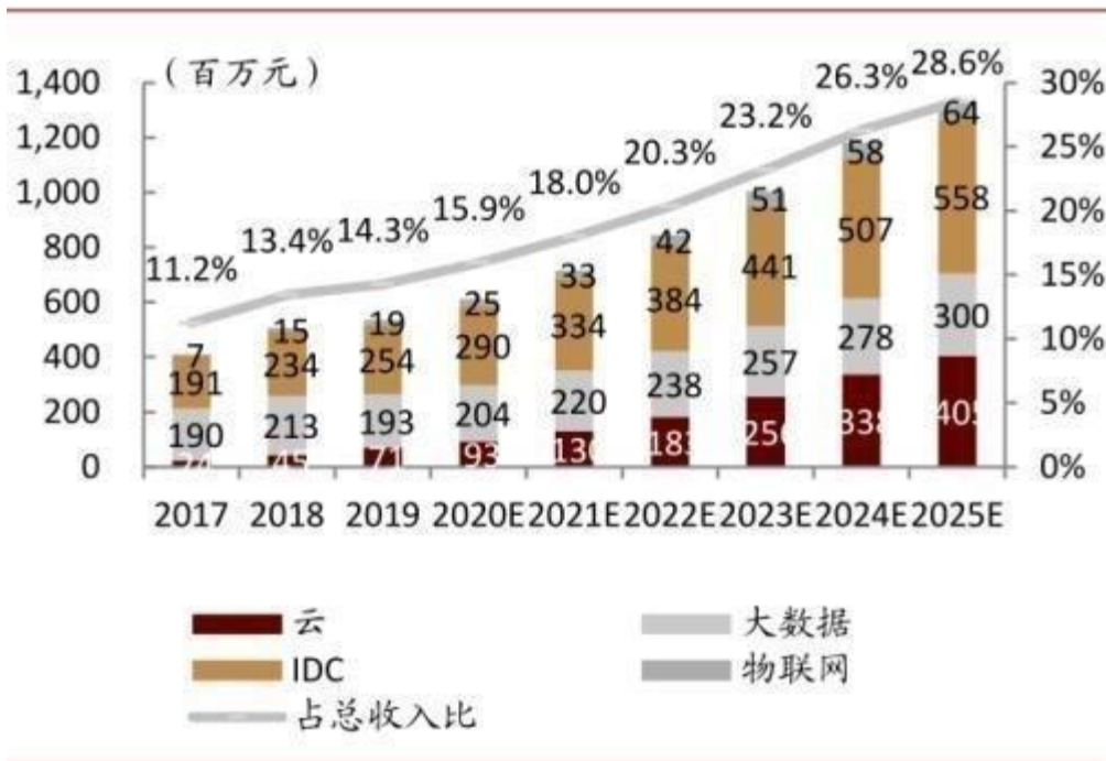
图表：中国电信：十四五产业互联网收入预测