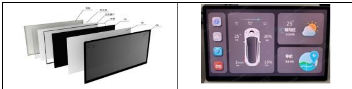
公司车载显示模组