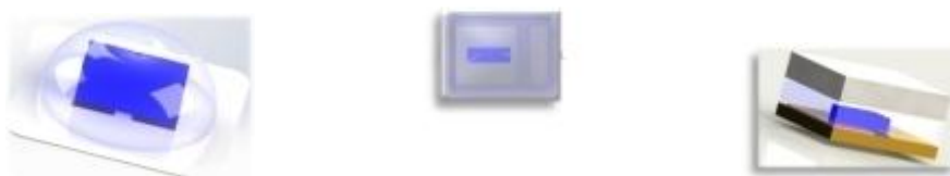
公司 MiniLED 背光器件

公司新型显示制造端产品包括直下式背光模组光电系统、侧入式背光模组光电系统、量子点显示光电系统与 Mini LED 背光显示光电系统。液晶显示作为当前最主要的显示技术，近年来随着消费升级及技术进步，不断朝着高清、高亮度、高色域超轻薄方向发展。公司注重显示技术的不断创新，解决客户痛点及市场需求，先后完成了超轻薄 OD10 直下式背光模组光电系统，灯驱一体全倒装 COB MiniLED 背光显示光电系统，灯驱一体 POB MiniLED 背光显示光电系统，车载 Mini 背光显示光电系统、倒装大功率高光效直下式背光模组光电系统等新产品开发设计，并成功批量应用于国内一线品牌客户创维、海信、小米、华为智慧屏等终端客户。公司侧入式背光模组光电系统采用高光效光源 LED 封装，超窄结构设计，具有长寿命可靠性、光衰小、色坐标偏移小，节能护眼等特点，不仅被国内一线电视品牌客户广泛采用，也应用于超薄电脑显示器终端满足 LG、三星、惠普、华为等客户需求。公司车载 Mini 背光显示光电系统可直接作为显示模组，其他背光模组光电系统是显示模组的重要组成部分。