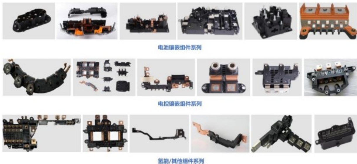
图 2：公司智能终端领域主要产品图