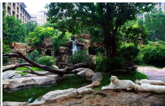
广州长隆酒店二期立体绿化项目