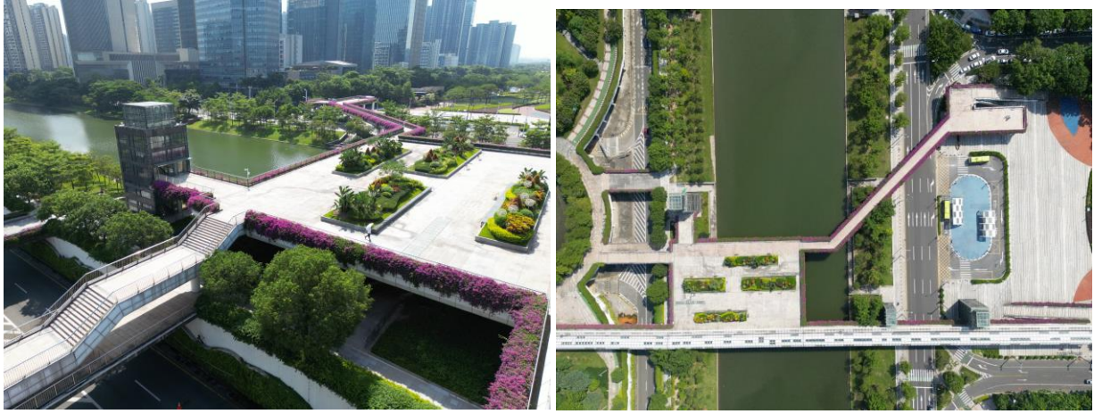
佛山大良-城市运营项目

署战略合作协议，共同推进城市运营领域相关项目落地。截至报告期末，公司已持续为全国上百座城市提供大项目管养服务，如深圳前海环境和绿化“双提升”工程绿化管养项目、佛山顺德大良“物业城市”时花采购及配套服务、广州天环广场绿植养护、开平市城区及人民公园绿化养护等。