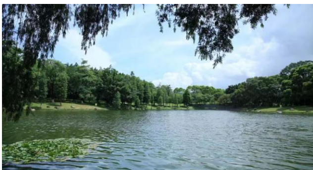
东莞松山湖中心公园水生态修复工程

林业与园林技术咨询业务拥有一支专家领衔、多专业融合、落地经验丰富的技术咨询团队。通过融合普邦股份研究、规划、设计、施工、养护、苗圃管理等专业技术力量，全面调动林业园林社会专家资源，形成多专业、宽角度、优服务的咨询模式，提供园林科技咨询服务（如科技项目研究、城市绿地系统及专项规划、园林城市评估&创建&复查、古树名木复壮方案、技术标准编制、景观评估及修复建议、树种规划、园林历史风貌保护与修复研究等）、林业科技咨询服务（林业调查、林业咨询、林业规划设计、生态修复等），为客户提供专业解决方案。