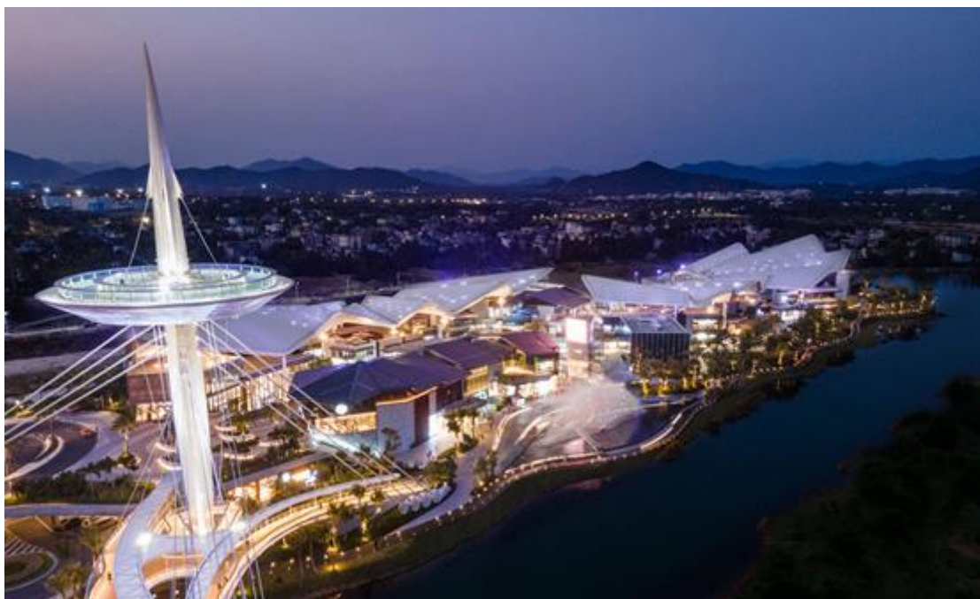
三亚国际免税城二期-设计项目

公司生态景观业务包括规划设计、工程建设和花木产销。普邦股份通过以生态园林为核心的全产业链，发挥业务协同，资源整合优势，打造“策划咨询-规划设计-投融资服务-工程建设-招商运营”等五位一体的商业模式，为各地方政府、企业提供生态环境建设全领域、全过程、全要素的一揽子服务。目前，普邦股份完成了众多成熟且有较强社会影响力的城市园林建设及旅游综合体项目，累积了丰富的项目建设和运营经验，业务类型覆盖旅游度假区、森林公园、生态湖泊、生态湿地、博览会展园、产业园区、会展中心、城市公园等，与各地政府、企业建立了长期良好的合作关系。2022 年公司完成多个精品项目，如广州寺右万科中心、广州粤海云港城、广州越秀·大学城和樾府、三亚国际免税城二期等。