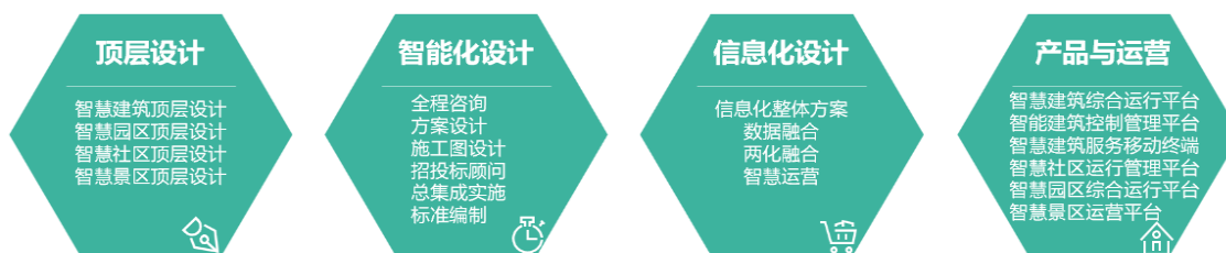
延华智慧城市与云平台业务全生命周期管理和服

在数字中国和城市全面数字化的背景下，公司立足于数字化转型，关注新技术应用、城市智慧大脑、智慧中台、新一代信息技术和创新场景、大模型、数字孪生在建筑的应用，在大型城市综合体、大型公建、智慧医院、数据中心、超高层建筑、星级酒店、智慧校园、智慧社区等建筑细分领域持续发力，为城市及建筑提供从顶层设计与咨询、智能化设计、信息化设计、平台运营，全生命周期的解决方案；助力解决城市运营、管理提供城市智慧运行、统一管理和精准服务等发展过程中的疑难问题，助力城市数字化转型、提高城市运营管理服务水平、提升产业发展质量和市民生活幸福感，增强城市综合竞争力。