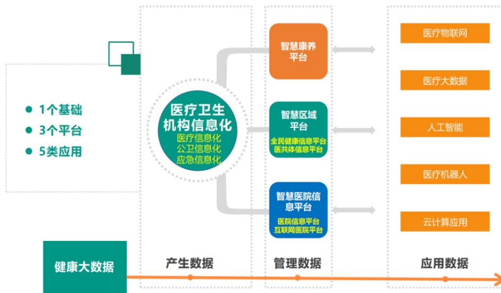
延华智慧医疗与大健康业务“1+3+5”的发展战略

公司以医院信息化系统-延华医疗云平台（YHCloud）为基础，提供智慧医疗解决方案、医疗大数据解决方案以及互联网医疗平台和解决方案，搭建智慧医院、智慧区域、智慧康养多层次健康大数据平台。