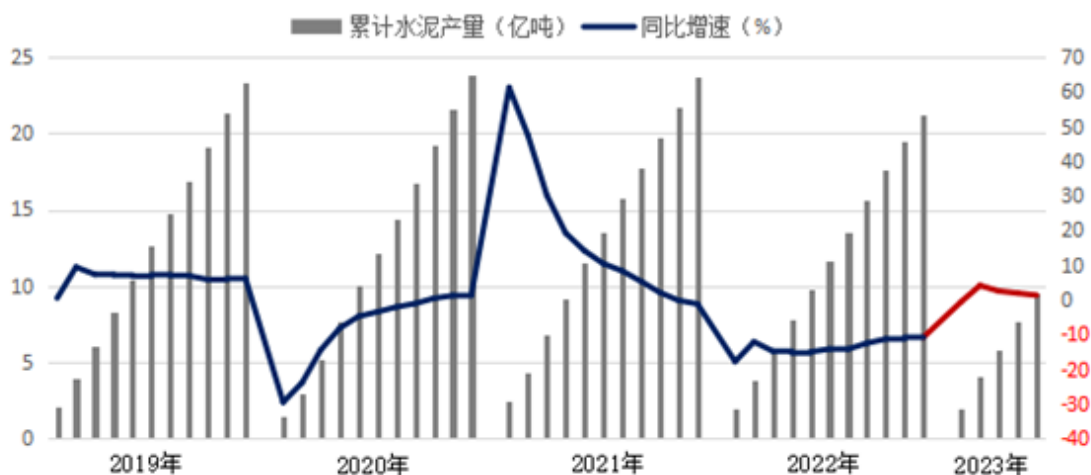
近五年全国月度累计水泥产量及同比增速变化趋势